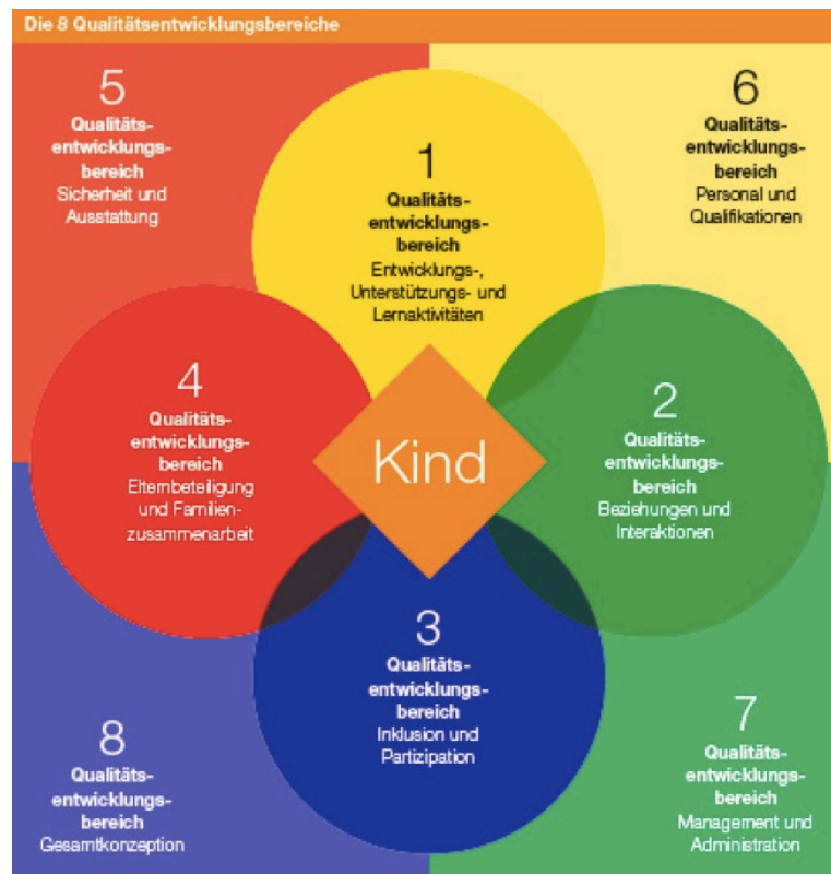
Abbildung 1. Modell der pädagogischen Qualität in Tagesstrukturen (Stamm, 2013).

Die inneren vier Entwicklungsbereiche des Modells der pädagogischen Qualität in Tagesstrukturen bilden prozessuale Qualitätsaspekte ab, welche den direkten Umgang mit den Kindern und Bezugspersonen umfassen. Die vier äusseren Entwicklungsbereiche fokussieren die Strukturqualität. Dazu gehören Aspekte wie die altersgerechte Raumgestaltung, das Vorhandensein bzw. Weiterentwickeln von Konzepten, Leitbilder etc. Ein ideales Zusammenspiel von inneren und äusseren Qualitätsaspekten unterstützt die kindliche Entwicklung nachweislich positiv (Stamm, 2013). Die Kompetenzen, die im CAS LIT gefördert bzw. erweitert werden, basieren auf diesen inneren und äusseren Qualitätsaspekten sowie deren Zusammenspiel aus der Perspektive von Leitungspersonen in Tagesstrukturen, indem aus den Qualitätsaspekten bzw. deren Zusammenspiel Aufgabenbereiche und spezifische Aspekte abgeleitet und in Form von Kompetenzen im CAS LIT umgesetzt werden (siehe Kap. 3).