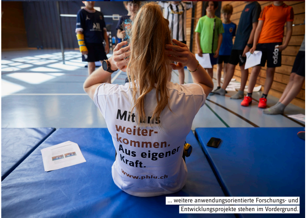
... weitere anwendungsorientierte Forschungs- und Entwicklungsprojekte stehen im Vordergrund.