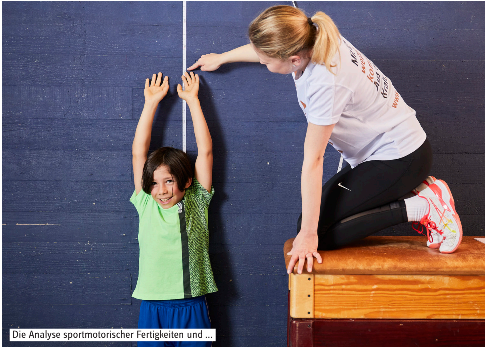
Die Analyse sportmotorischer Fertigkeiten und ...