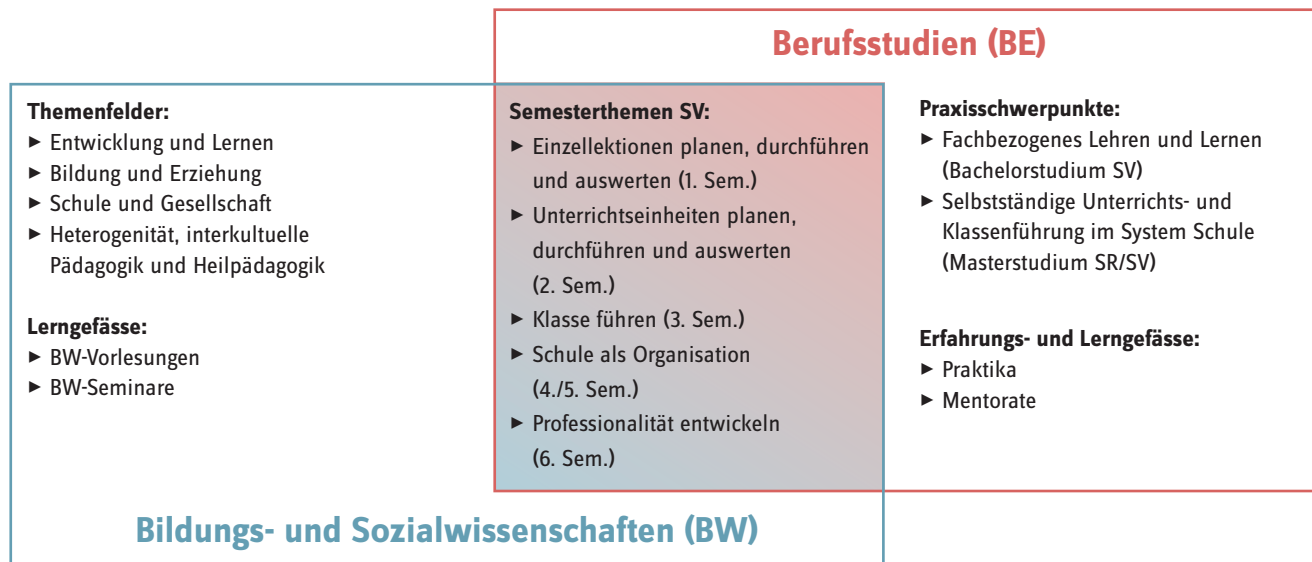
Zusammenspiel BW und BE mit Fokus auf die Semesterthemen SV.

Das Zusammenspiel der beiden Studienbereiche BW und BE mit ihren je unterschiedlichen thematischen Ausrichtungen und Gefässen wird in der folgenden Abbildung 3 deutlich, wobei die Semesterthemen die gemeinsame Schnittmenge bilden.