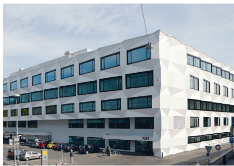
Uni/PH-Gebäude • www.phlu.ch/up Froburgstrasse 3, 6002 Luzern