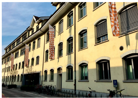
Sentimatt • www.phlu.ch/se Sentimatt 1, 6003 Luzern