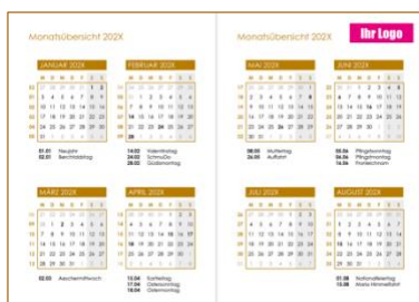
Beispiel Logo auf der Seite «Monatsübersicht»