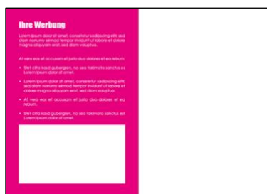
Beispiel Werbeanzeige vor dem Kalendermonat