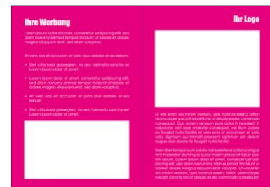
Beispiel Werbeanzeige vor jedem Kalendermonat