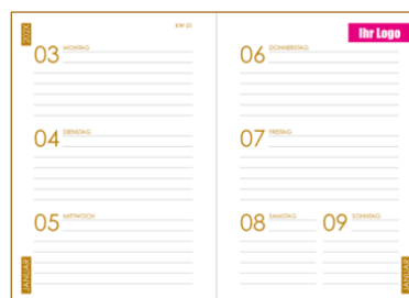
Beispiel Logo auf der Seite «Wochenübersicht»