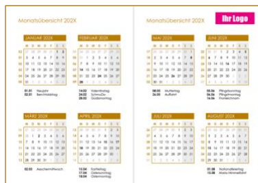
Beispiel Logo auf der Seite «Monatsübersicht»