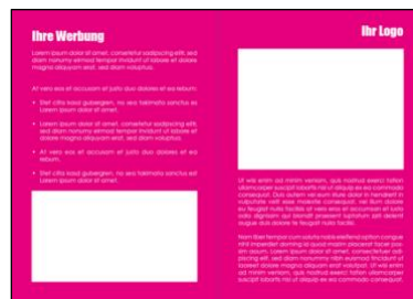
Beispiel Werbeanzeige vor dem Kalendermonat