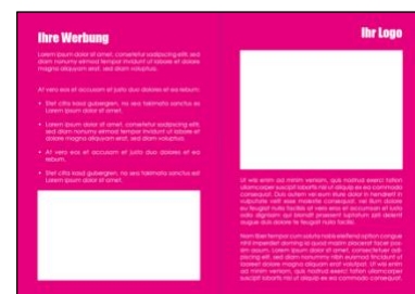
Beispiel Werbeanzeige vor dem Kalendermonat