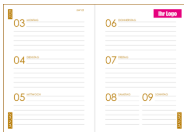
Beispiel Logo auf der Seite «Wochenübersicht»