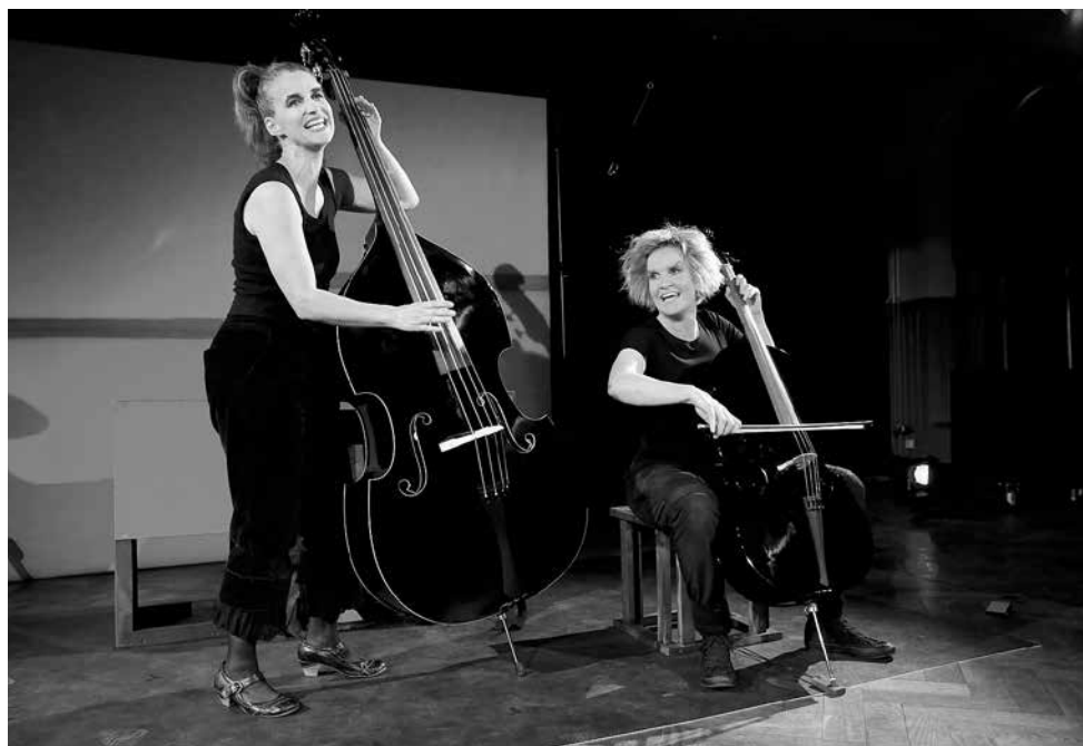
Glücksvogel, Theater Tabula Rasa