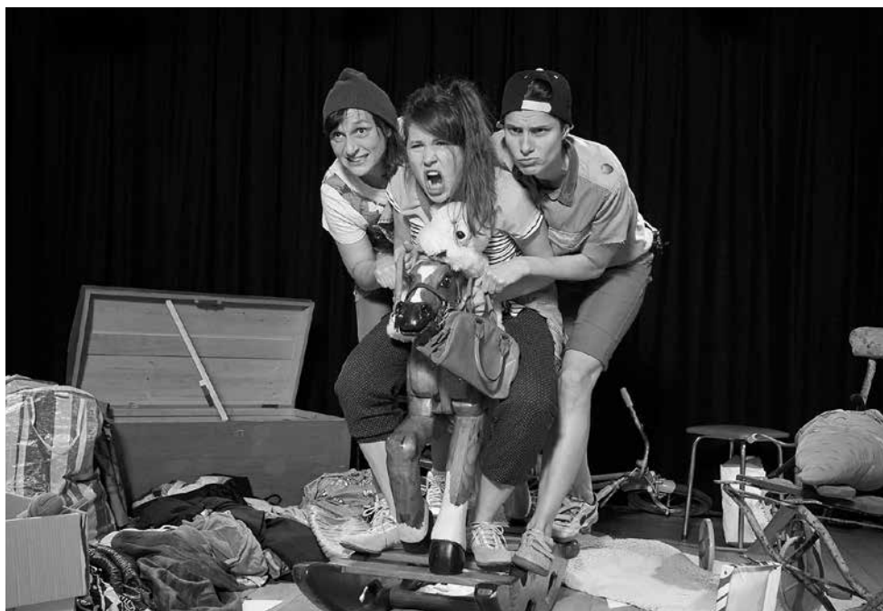
3, 2, 1 - Tussi wend mer keisl, Triplette, © Marco Sieber