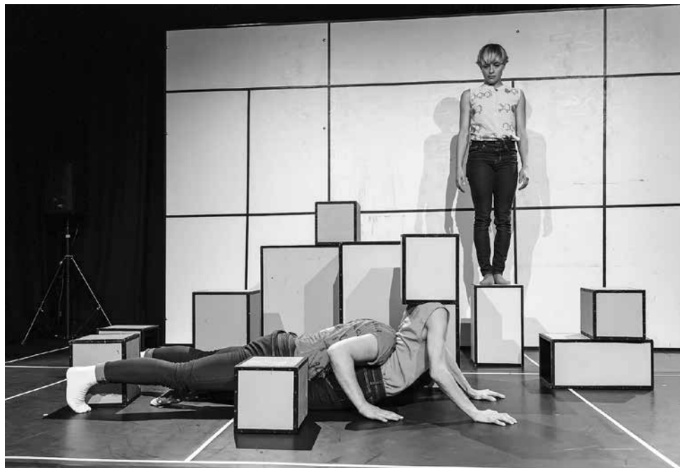
Für immer und nie, Kumpane, ©Angi Paz Soldan