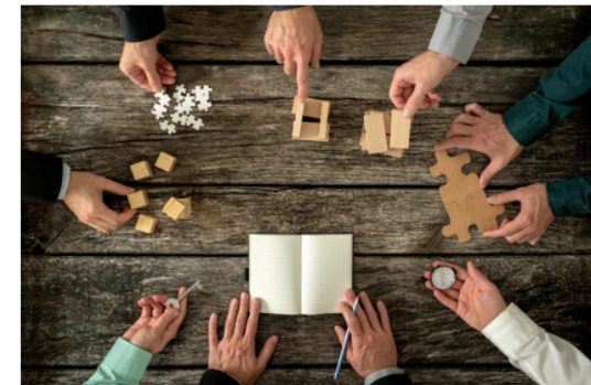
Weiterbildung und Dienstleistungen

CAS Mentoring Berufsstudien Eine Weiterbildung für Hochschuldozierende